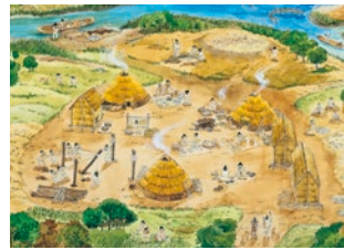
縄文時代 保美貝塚風景復元図

全国的に有名な渥美半島の貝塚。3000年あまり昔の私たちの祖先の生活の知恵や工夫を最新の成果をもとに展示します。日本一のマッチョマン縄文人をはじめ百年ぶりに渥美半島に里帰りする資料もあります。