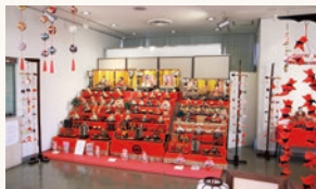
昨年のひな祭り展

土人形、御殿飾りひな人形、 段飾りひな人形など明治 時代から現代までの変わ りゆくひな人形の変遷を展 示します。