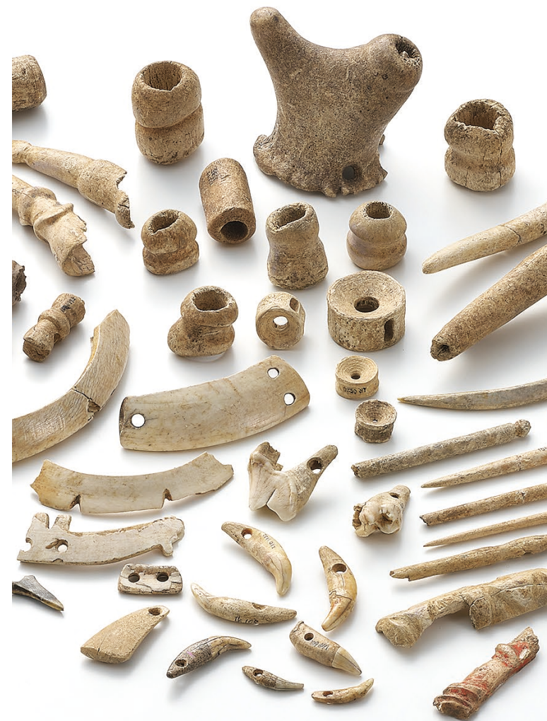
企画展 渥美半島貝塚展 骨角などで作られたアクセサリー(伊川津貝塚出土)