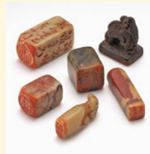
田原市指定文化財 椿椿山印額

現代ではペーパーレス化が進み、ハンコを捺す機会が少なくなってきました。江戸時代以降は絵画や書の落款とともにハンコが捺され、その作者であることを示していました。本展では、華椿系画家が使用したハンコや絵画、書などに捺されたハンコに注目します。