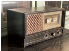
ラジオ 昭和時代中期

昭和時代に巻き起こったうねりとその間に起きた戦争は、渥美半島に住む人たちの生活や、人生そのものにもやおうなく大きな影響を与えました。市内に残る物や紙の資料からそのありよう変化を振り返ります。