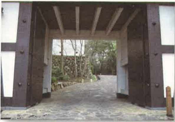
●桜門から見える二の丸櫓の石垣

さて、再び桜門の前に立ってみましょう。再興された桜門の門扉の内側をのぞくと、進行方向に立ち塞ぐように二の丸櫓の石垣が目に入ります。桜門の石垣より高く積まれています。また、石垣を安定させるため、角は横長の石が互い違いに積まれています。